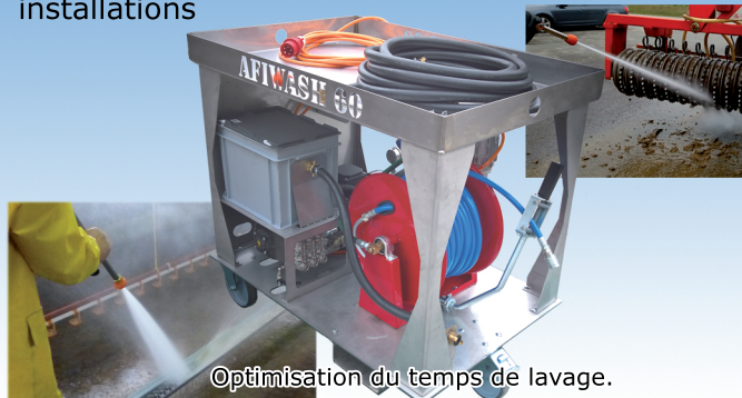
Optimisation du temps de lavage.

Nettoyeur haute pression et haut débit pour un nettoyage rapide et efficace de vos installations