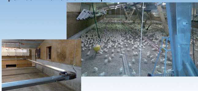
Etudié pour un nettoyage et mise en place très rapide

Élévation de la chaîne, pipettes et caillebotis par commande électrique.